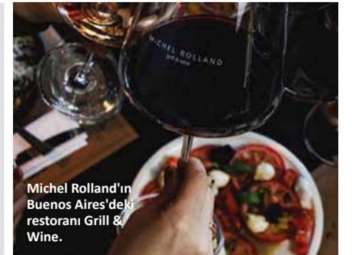
Michel Rolland'ın Buenos Aires'deki restoranı Grill & Wine.

Rolland, yoğun programına karşın Türkiye'ye ve özellikle Ege Bölgesi'ne özel önem verdi.